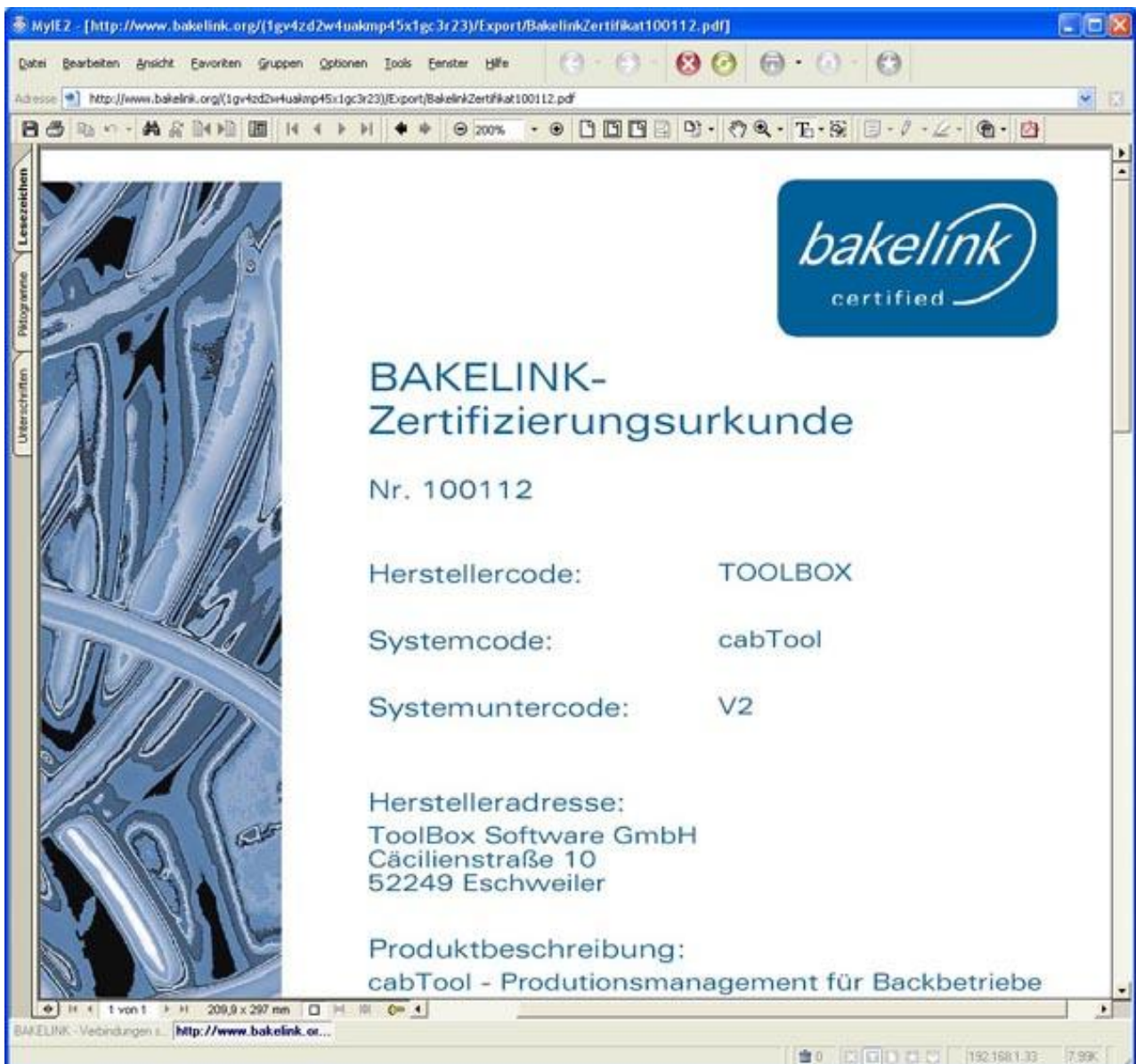
Abbildung 3: Blick auf eine Zertifizierungsurkunde.

Mit einem Klick auf das Suchergebnis werden weitere Informationen zu den unterstützten Dateninhalten in Tabellenform angezeigt. Nach allgemeinen Angaben zu Unternehmen, Ansprechpartnern und Produktbezeichnungen gibt es die Möglichkeit, sich über die technischen Datenfeld-Inhalte zu informieren. Die dargestellten Datenfelder wurden von Fach-Arbeitskreisen bei der Entwicklung des Schnittstellen-Standards festgelegt. Es wird unterschieden zwischen Feldnamen (Wochentag, Artikelnummer, etc...) und Feldtypen (alpha num, date, time, etc...). Jedes Datenfeld, dessen Inhalte von dem jeweiligen Produkt unterstützt werden, ist mit einem Häkchen gekennzeichnet. Besonders komfortabel ist der Vergleich von zwei Zertifikaten hinsichtlich der jeweils unterstützten Dateninhalte. Hier zeigt sich zum Beispiel, welche Daten ein zertifiziertes Backprogramm mit einer zertifizierten Kasse austauschen kann.